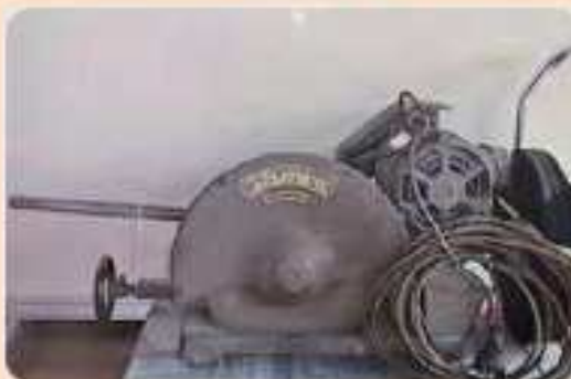
写真 説明 保証

品名：工作用切断機 メーカー：盛光 型式：CC-1 年式：1983 仕様：テーブルサイズ 455×310mm カッター寸法 155×155mm 重量 60kg 外寸 W460 D500 H400