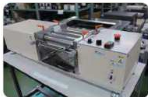
写真 説明 保証

品名：切断機 (高精度自動送り) メーカー：富士商工 型式：SCM-600E 年式： 仕様：切断有効幅 660 mm 以内 切断長さ設定 0.2 ~ 9999.8 mm 切断モーター 0.4KW