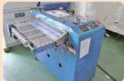
写真 説明 保証

品名：精密自動研磨機 メーカー：丸本ストルアス 型式：テグラフォース -5 年式： 仕様：試料回転数 150rpm 固定試料板 12 ~ 40mm の試料を 最大 6 個まで並置可能 加圧力 10N-100N (5N 単位) 研磨料調節アダプター 0.02mm 単位での研磨料調整可能