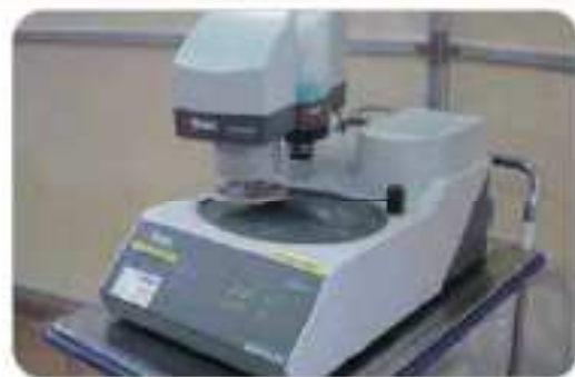
写真 説明 保証

品名：高速カッター メーカー：昭和電機 型式：HCW-16 年式：1976 仕様：電源 200V 50/60HZ 三相 出力 2.2/2.2KW 回転数 2200/2200RPM ホイールサイズ 405X2.5X25.4mm