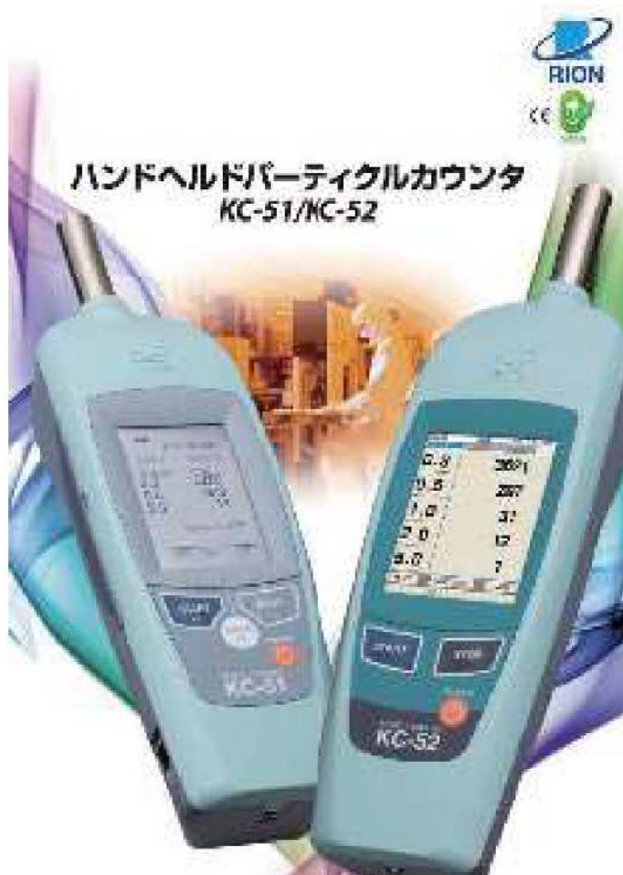
ハンドヘルドパーティクルカウンタ KC-51/KC-52