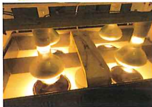
光源用電球 冷却ファン