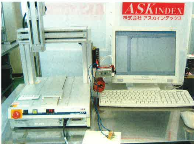
卓上口ロボットの連続動作確認