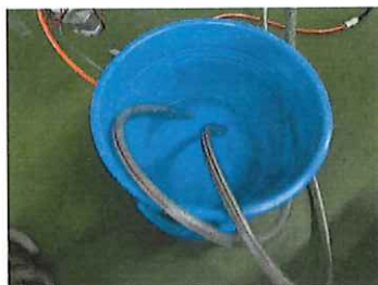
バケツからバケツに水排出。