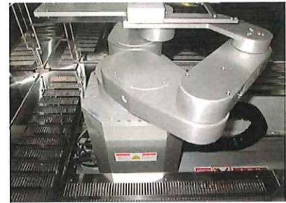
搬送ロボット無反応