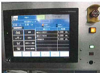
モニタは表示するが 付帯設備が繋がって いない為動作しない