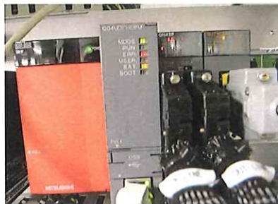
PLC Error (ユニットが外されている)