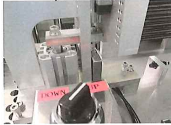
UP切り替えスイッチ