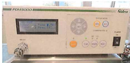
塗布最大タイマー確認