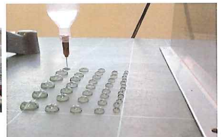
塗布設定:圧力/時間