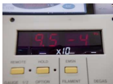
・到達圧力: 9.5 \times 10^{-4} Pa