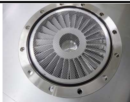
・吸気フランジ部