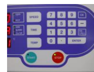
操作パネルスイッチ