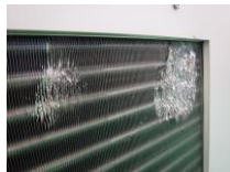
熱交換機 潰れ有り