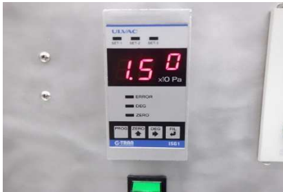
ISG1(ディスプレイ表示)