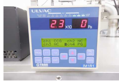
IM1R1(ディスプレイ表示)