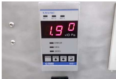
ISG1 (ディスプレイ表示)