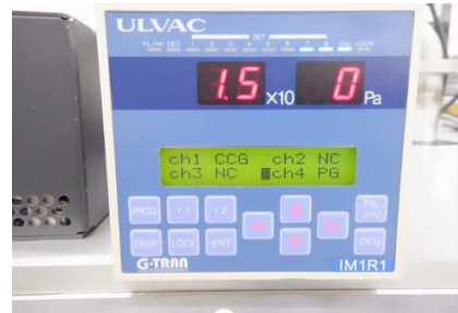
IM1R1 (ディスプレイ表示)