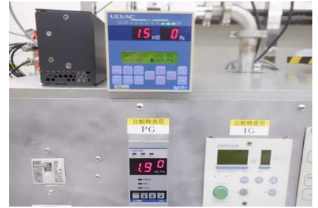
センサユニット (SP1) * 測定子: WP-01