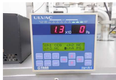
IM1R1 (ディスプレイ表示)