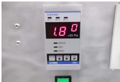
ISG1 (ディスプレイ表示)