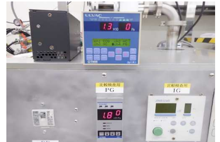
センサユニット(SP1) * 測定子: WP-01