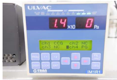
IM1R1(ディスプレイ表示)