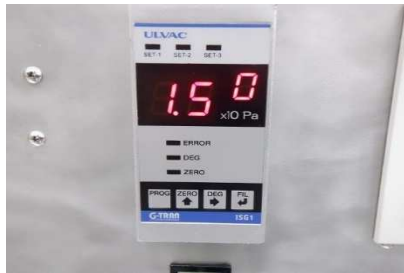
ISG1(ディスプレイ表示)