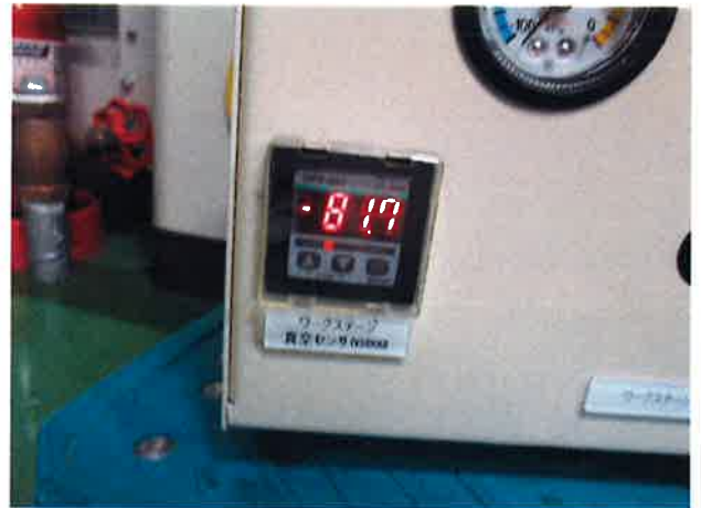
アナログメーター故障