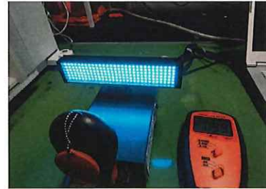
※LED発行面より100mm位置のLUX測定