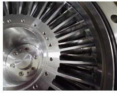
【STOPまで】 停止時間(30分20秒)