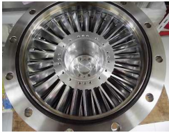
【NORMALまで】 起動時間(12分33秒)