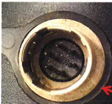
専用の6ピンコネクター