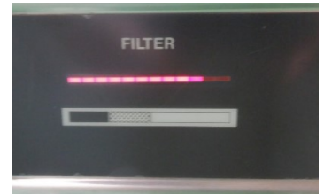
風速インジケータ