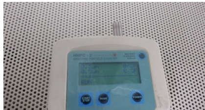
取扱説明書(有・無) パーティクル0.3μ、0.5μ 0個(内側、排気部)