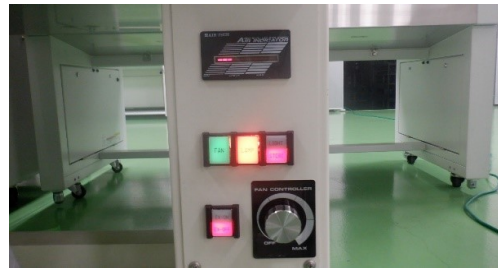
FANコントロール小、UV、EX/OFFの状態