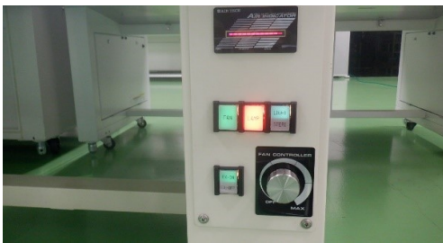
FANコントロール大、蛍光灯、EX/ONの状態