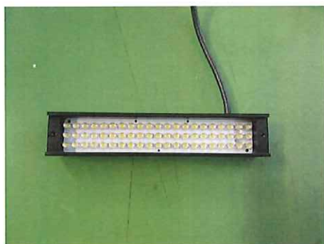
電源スイッチ投入前