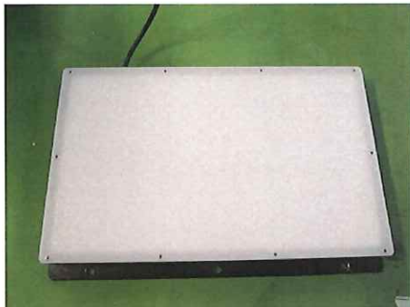
電源スイッチ投入前