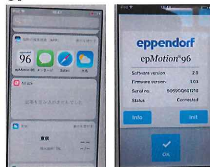
写真 1 写真 2