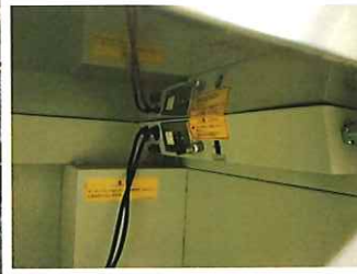
ガス電磁弁、真空ポンプ、フットSW取り付け部(フットSW、1個付属)