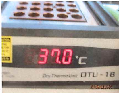
設定温度37℃と設定温度110℃での運転