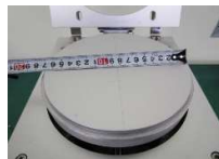
ステージφ175 リング外寸φ180