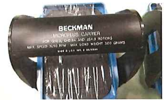
マイクロプラスキャリアx4 MAX3250rpm