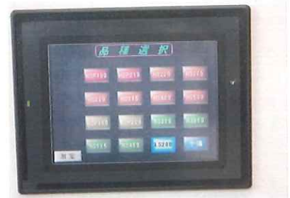
タッチパネル表示画面