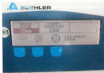
パラメーター MOLD SIZE,TEMPERATURE各設定