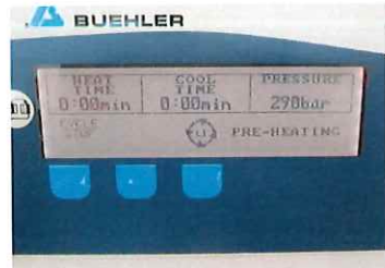
CYCLE START 開始