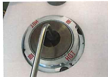
ルツボ内温度確認