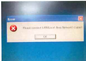
検査ソフトウェア立上げ ネットワークエラー発生