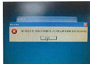
プロセスエラー発生