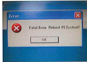
ロボットエラー発生