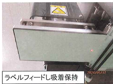
ラベルフィードし吸着保持