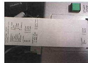
プリンター出力確認