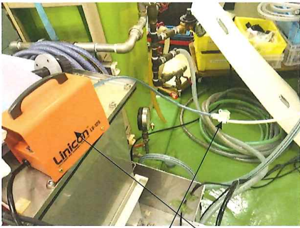
排気異常メーターからのパイプ真空ポンプで減圧