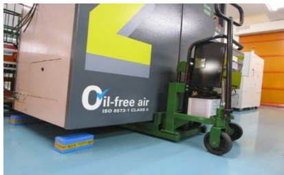
最大積載能力1000Kgの昇降を確認