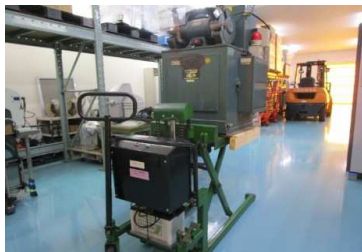
最大地上高 850mm 最低地上高 80mm