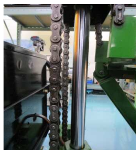
シリンダー状態 オイル漏れ無し 錆無し