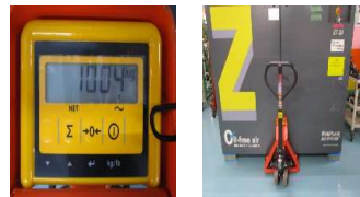
参考写真(重量計測)