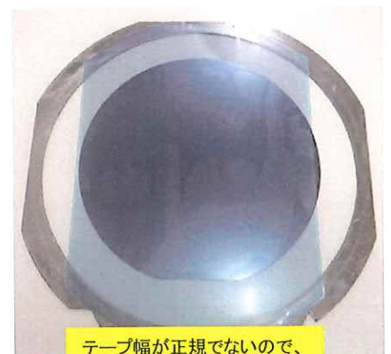
テープ幅が正規でないので、