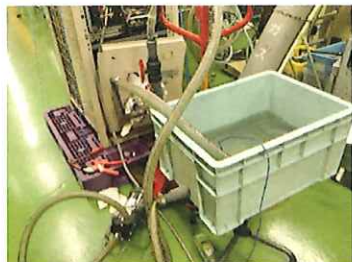
弊社マグネットポンプでプラ箱から水循環