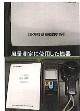
風量測定に使用した機器