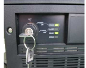
レーザー印字可能状態