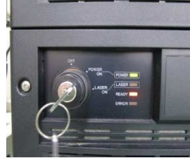
レーザー準備状態