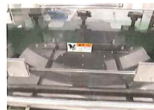
カッター部動作正常