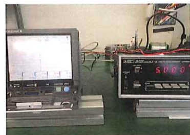
測定環境(電圧測定)