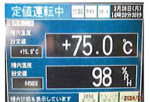
設定温度75℃/20%RHと98%RHの運転画面