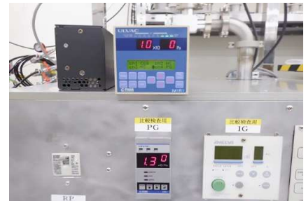
センサユニット(SP1) * 測定子:WP-02