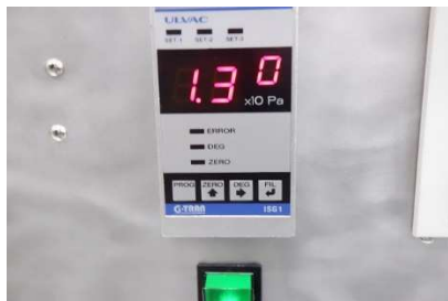
ISG1(ディスプレイ表示測定圧力) : 1.3Pa