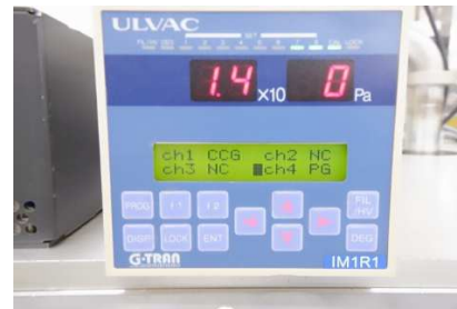
IM1R1(ディスプレイ表示測定圧力) : 1.4Pa