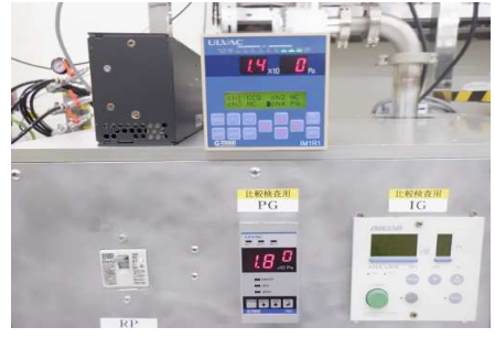
センサユニット (SP1) * 測定子:WP-02