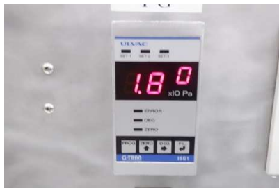
ISG1(ディスプレイ表示測定圧力) : 1.8Pa