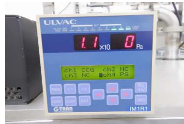
IM1R1(ディスプレイ表示測定圧力) : 1.1Pa