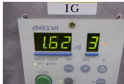
測定ゲージはアネルバMG-2(社内検査用)