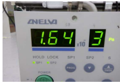
(NC0974) M-431HG 表示圧力 : 1.64 \times 10^{-3} \text{ Pa}