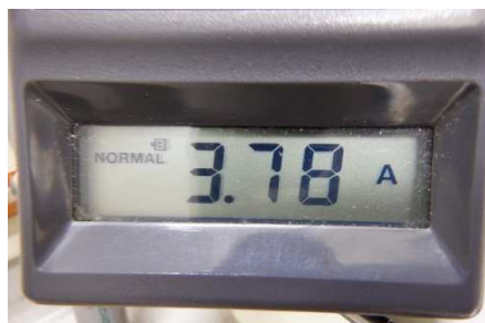
電流値 : 3.78A