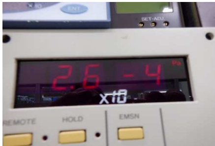
・到達圧力:2.6 × 10 -4 Pa