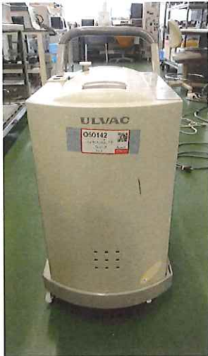
ディテクター全体