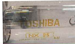
(ナトリウム)ランプの点灯直後の確認